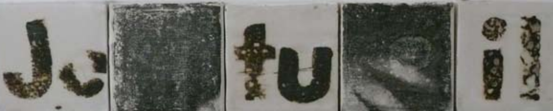
Pronominal : Impressions mixtes sur céramique, 62 x 10 cm, 2010

Massimo Bignardi, Critique d'art Concreta, Toscane, 2011